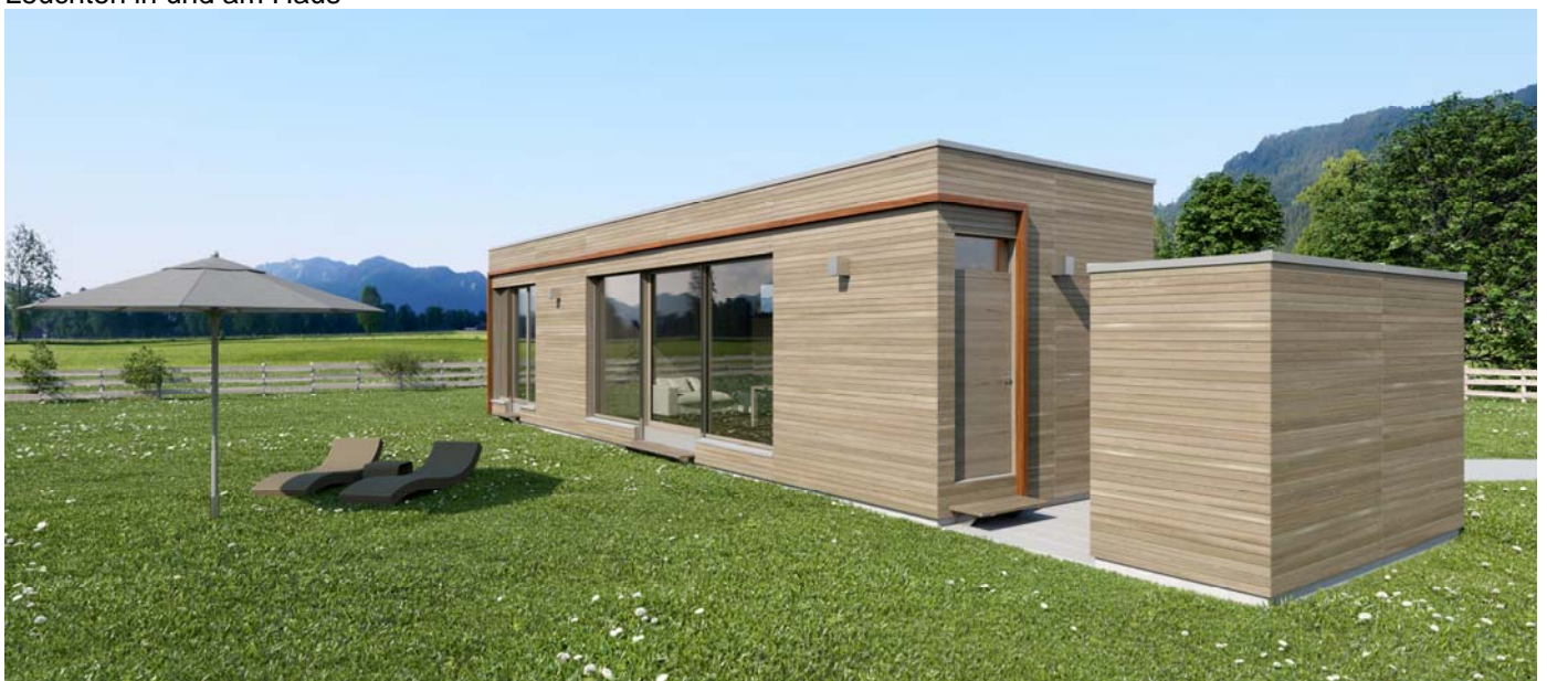
Eingang / Vorraum

sämtliche Einbaumöbel für Vorraum, Bad, Wohn-, Ess- und beide Schlafzimmer komplette Küche mit Geräten Leuchten in und am Haus